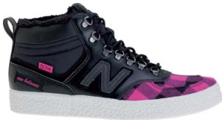
プランディーピンク(P)