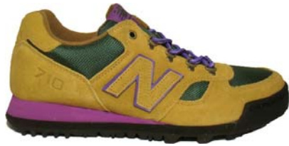
グリーン／ブラウン(GB)

ミッドカットのアウトドアモデル「710」を、より着脱のしやすいローカットスタイルでリファイン。オリジナルカラーをイメージしたGB、シックなBK、モダンなGPの3色をユニセックスサイズで展開。