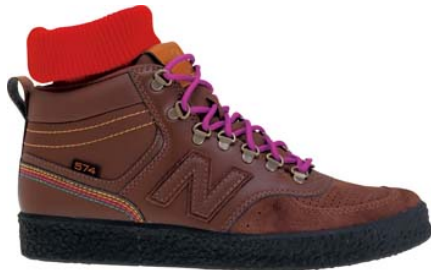
メジャーブラウン(M)

ライフスタイルシューズとして人気の「574」をタウンに映えるアクティブなブーツスタイルで提案。履き口の取り外し可能なニットが印象的なタイプ(C、M、S)と、爪先部にバフファローチェックをほどこしたタイプ(W、P)の2タイプで提案。