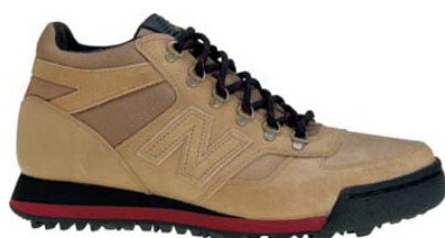
ベージュ/オイスター(BO)