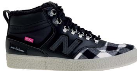
ホワイト/ブラック(W)

商品名 : WRC574B (2010年8月発売) カラー : メジャーブラウン(M)、シンダー(C)、 シーポート(S)、プランディーピンク(P)、 ホワイト/ブラック(W) サイズ (ウイズ/センチ) : D/22.0~25.0cm 価格 : ¥8,800 (税込み ¥9,240)