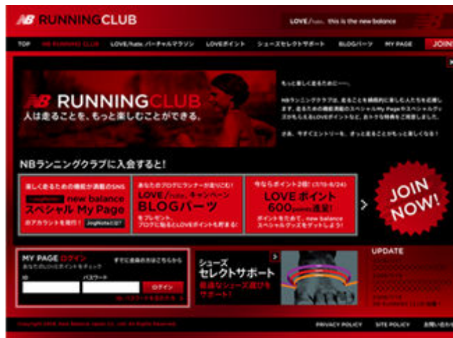
NB RUNNING CLUB トップページ

株式会社ニューバランス ジャパン(本社:東京都中央区、代表取締役社長:林 喜弘)は、新しいブランドキャンペーン「LOVE/hate. this is the new balance」展開に連動し、2008年7月15日(火)よりランニングコミュニティサイト「NB RUNNING CLUB」をオープンいたします。また、新しいブランドキャンペーン立ち上げに際し、オフィシャルホームページもリニューアルいたします。ニューバランスはランニングカンパニーとして、ランニングに対するあらゆる葛藤を「LOVE」と「hate」という感情の中の微妙な関係で捉え、ランナーの気持ちに寄り添いランニングをより楽しんでいただけるようサポートしてまいります。